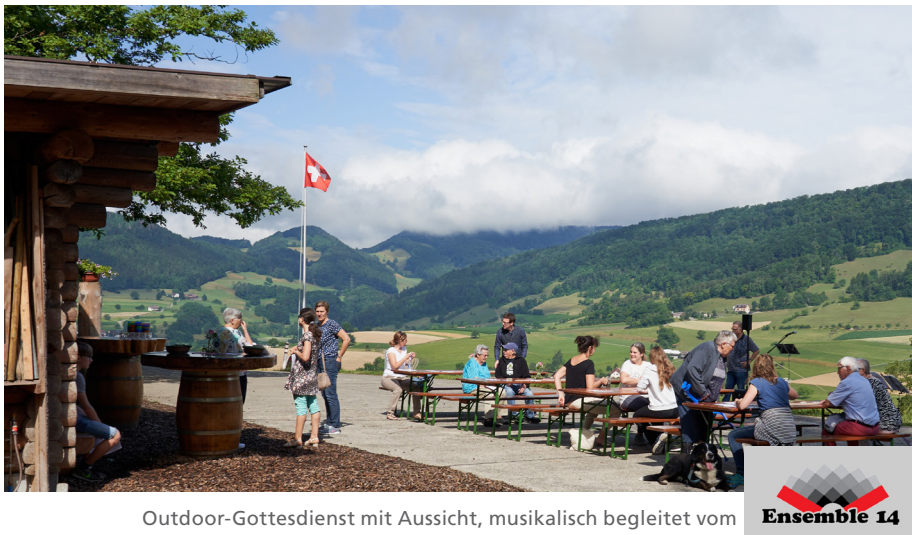
Outdoor-Gottesdienst mit Aussicht, musikalisch begleitet vom