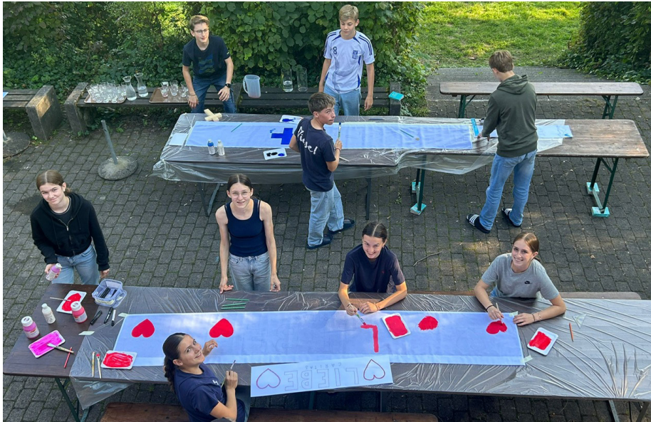
motiviert und engagierte Könfis beim Fahnen malen